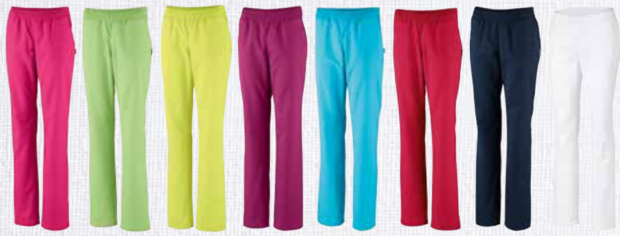
pink 3070004 apfelgrün 3070003 limette 3070005 berry 3070007 türkis 3070002 poppyrot 3070010 dark navy 3070006 weiß 3070008

Durch unterschiedliche Gewebezusammensetzungen können Farbabweichungen entstehen.