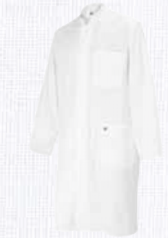
weiß 0320063 (215 g/m 2 ) 0320061 (200 g/m 2 )