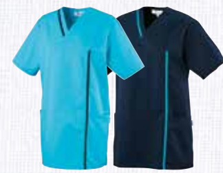
türkis/ dark navy 7440050 dark navy/ türkis 7440049