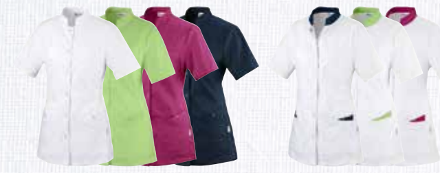
① weiß 2260010 ② apfelgrün 2260018 ③ berry 2260011 ④ dark navy 2260015 ⑤ weiß/ dark navy 2260014 ⑥ weiß/ apfelgrün 2260009 ⑦ weiß/ berry 2260008