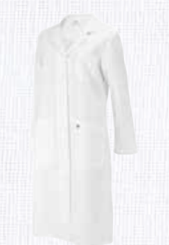
weiß 0460190 (215 g/m 2 ) 0460188 (200 g/m 2 )