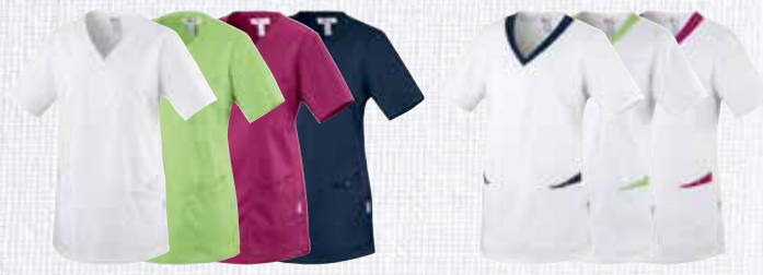
① weiß 7460004 ② apfelgrün 7460006 ③ berry 7460005 ④ dark navy 7460007 ⑤ weiß/ dark navy 7460003 ⑥ weiß/ apfelgrün 7460002 ⑦ weiß/ berry 7460001