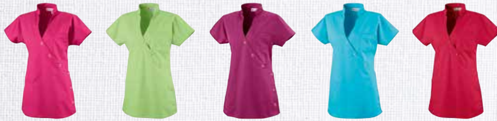
pink 2260006 apfelgrün 2260007 berry 2260013 türkis 2260012 poppyrot 2260028