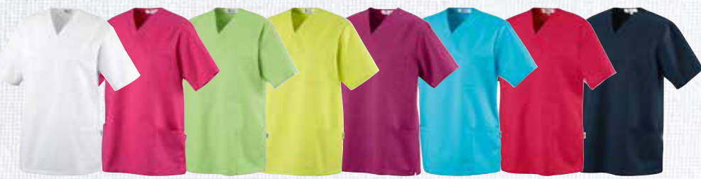
weiß 7440055 pink 7440056 apfelgrün 7440057 limette 7440058 berry 7440065 türkis 7440066 poppyrot 7440094 dark navy 7440067