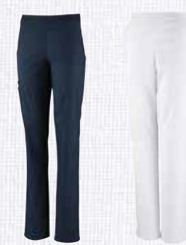
dark navy 2120009 weiß 2120010