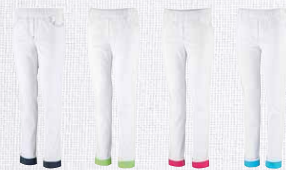
weiß/jeans 3970005 weiß/ apfelgrün 3970006 weiß/pink 3970007 weiß/türkis 3970008