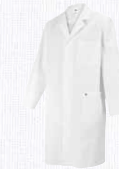
weiß 0310778 (215 g/m 2 ) 0310776 (200 g/m 2 )