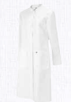
weiß 0760021 (215 g/m 2 ) 0760020 (200 g/m 2 )