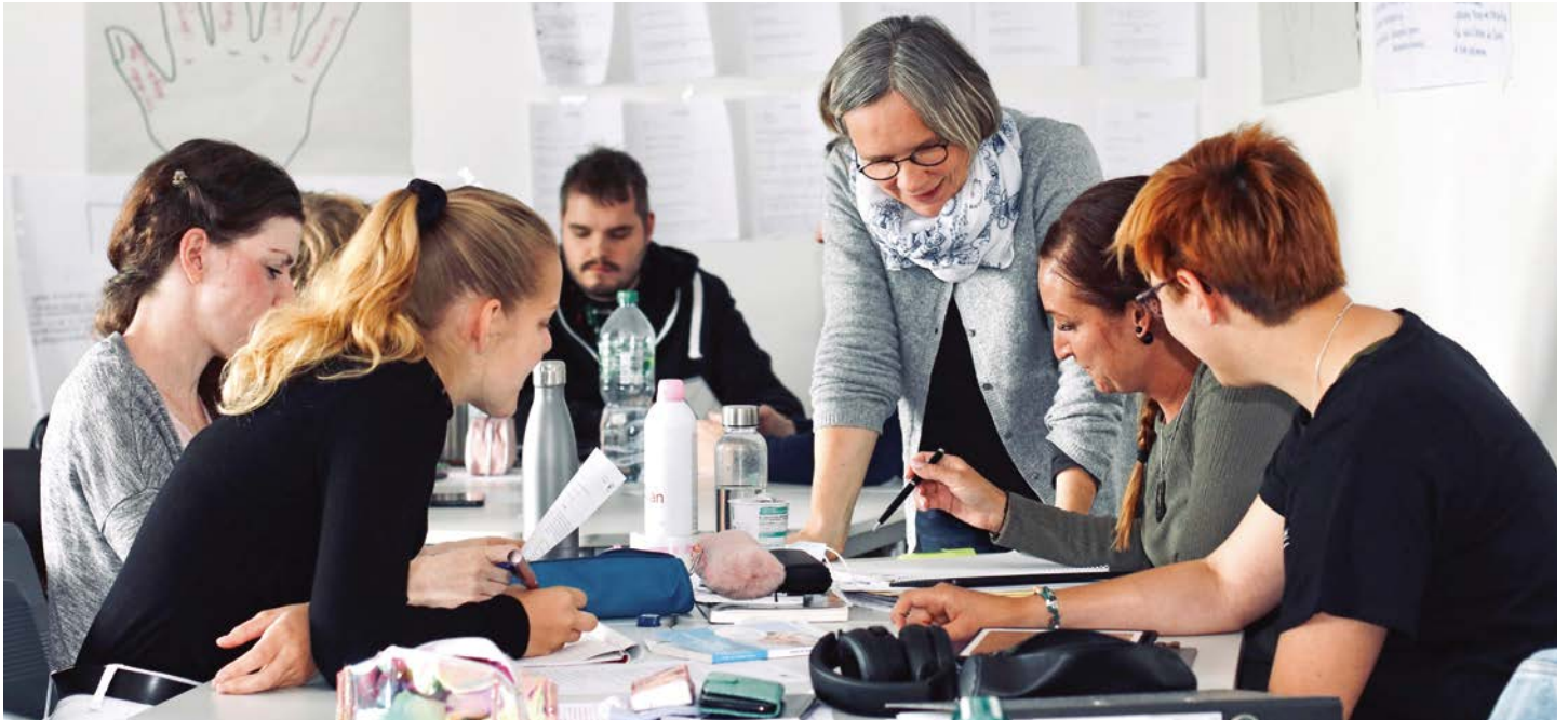
Auch in der schulischen Kultur und im Fortbildungsprogramm der DRK-Schule ist das Thema Resilienz fest verankert.

dabei über die reine Gesundheitsförderung weit hinaus. Sie betreffen das gesamte Unternehmen inklusive seines Selbstverständnisses, der Führungskultur, Prozessen, Strukturen und Abläufen. In einer sich ständig verändernden Arbeitswelt erkennen Unternehmen zunehmend die Notwendigkeit der Resilienzförderung.