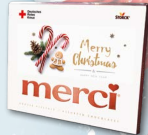
Merci – Große Vielfalt Art.-Nr. 03133