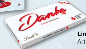
Lindt Rotkreuz-Schokolade Art.-Nr. 01904