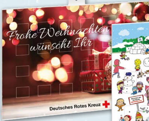
DRK-Adventskalender Art.-Nr. 01888