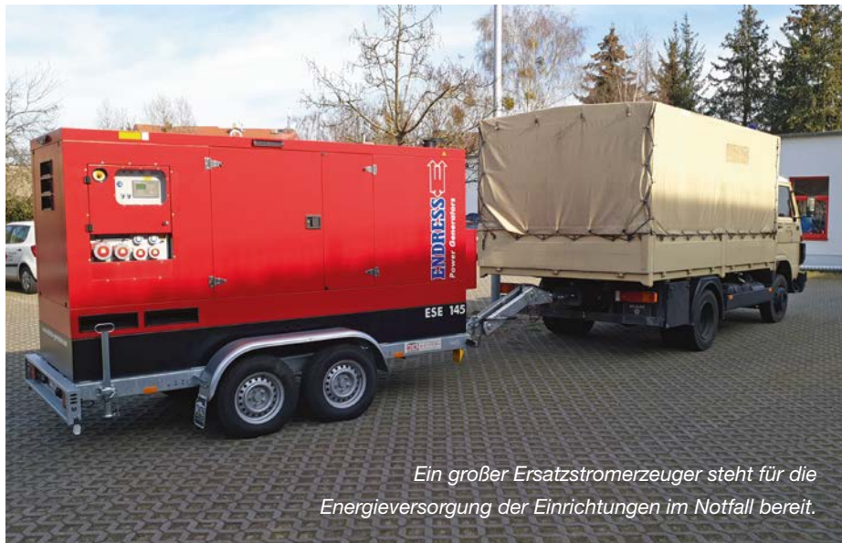
Ein großer Ersatzstromerzeuger steht für die Energieversorgung der Einrichtungen im Notfall bereit.

Drei Jahre Corona und über anderthalb Jahre Ukraine-Krieg haben vieles verändert und auf den Kopf gestellt, so auch unser Verständnis von Sicherheit und Krisen. Vor allem die Lieferengpässe zahlreicher, dringend benötigter Produkte haben uns alle vor große Herausforderungen gestellt, die zuvor so noch nicht dagewesen waren. Die Ereignisse haben dazu geführt, dass alltägliche Dinge auf einmal nicht mehr „normal“ waren und Abläufe neu gedacht werden mussten. Wir alle waren plötzlich mit neuen Situationen konfrontiert, die uns bis heute viel abverlangen. Um solche Zeiten gut zu überstehen, braucht es vor allem eines: einen gewissen Grad an Stabilität.