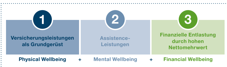
Die drei Vorteile der bKV

Berechnungsgrundlagen: Jahr 2022, StKl. 1, GKV ja, KiSt. ja, Kinder nein, Freibeträge nein. Jahresbruttogehalt 36.000,00 €, wohnhaft in Berlin, Alter 40 Jahre