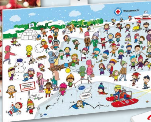
Wasserwacht-Adventskalender Art.-Nr. 03074